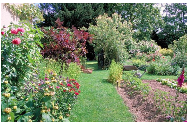
8 – Ouvrez votre jardin aux animaux alliés