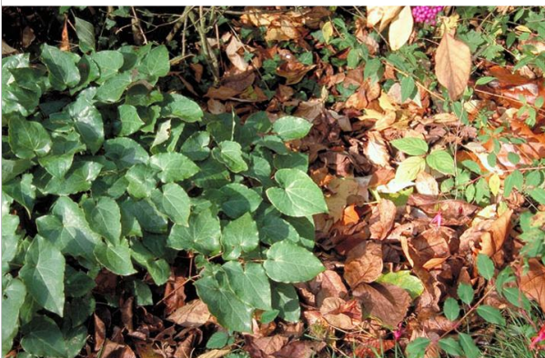
20 – Installez des refuges et des couettes pour l'hiver afin d'abriter les auxiliaires