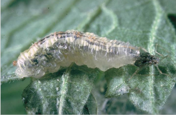
12 – La larve de syrpe mange aussi les pucerons et les jeunes chenilles