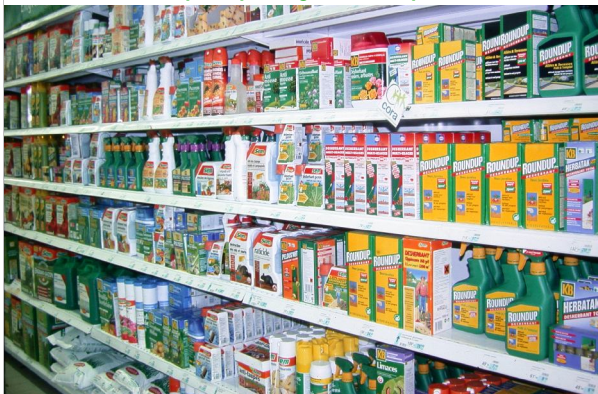
6 – Méfiez-vous des excès d'engrais et des traitements chimiques qui fragilisent les plantes