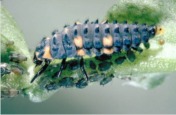
10 – La larve de coccinelle mange jusqu'à 60 pucerons par jour