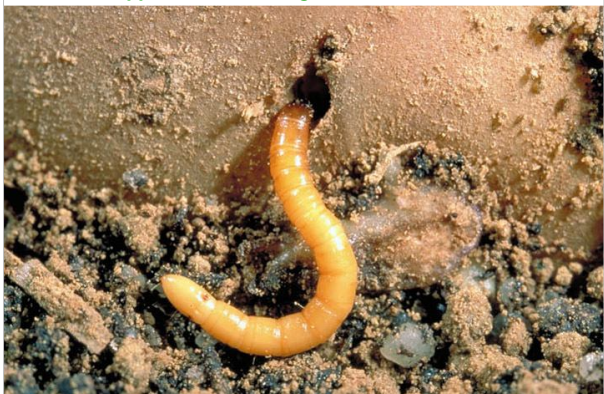
7 – Bannissez l'enfouissement du fumier qui favorise l'apparition de ravageurs et de maladies