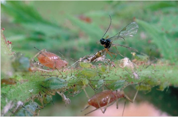
16 – L'aphidius, petite guêpe, est un auxiliaire discret