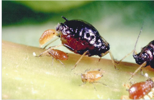
17 - Un puceron femelle mangé en avril, c'est plusieurs milliards de pucerons de moins en juin