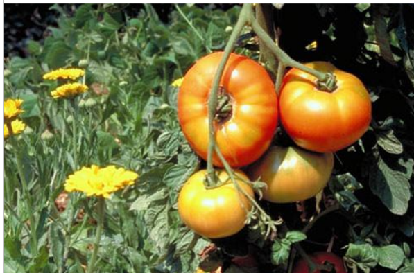
23 - Associez les œillets d'inde aux tomates