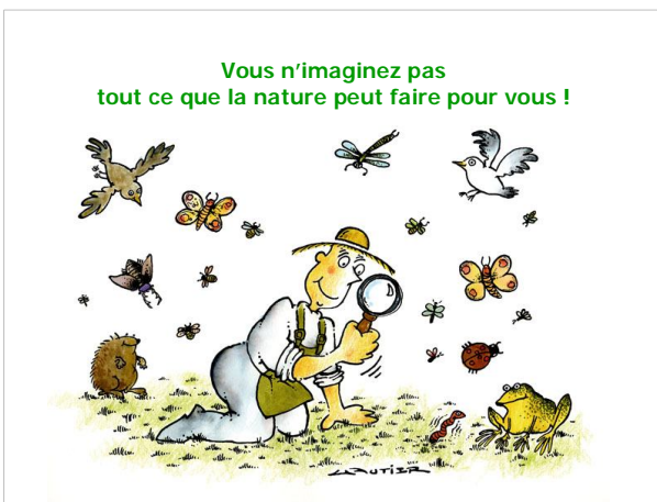
Vous n'imaginez pas tout ce que la nature peut faire pour vous !