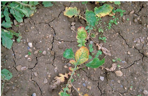
5 – Une terre laissée nue se tasse et asphyxie les plantes