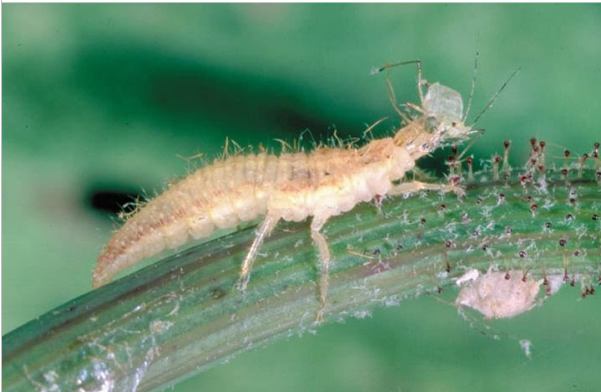
14 – La larve de chrysope est un prédateur redoutable pour les pucerons