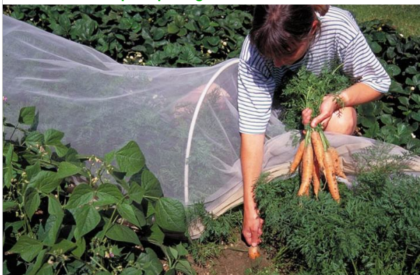
25 – Placez des filets anti-insectes pour protéger les carottes