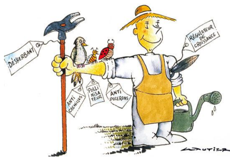
Comment lutter contre les parasites et les maladies