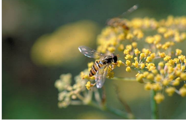
11 – Le syrpe est un pollinisateur qui intervient dès les premiers beaux jours du printemps