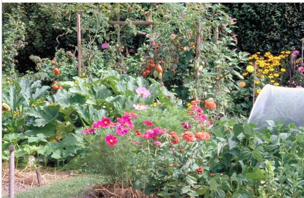
22 – Attirez les insectes auxiliaires dans le potager