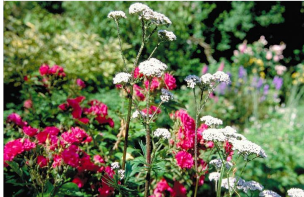
19 - Introduisez des plantes « appâts » pour attirer les auxiliaires et protéger les plantes sensibles