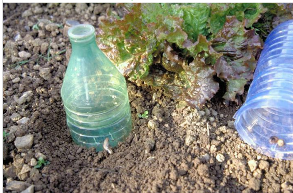
24 - Installez des pièges à limaces à l'abri de la pluie et des animaux