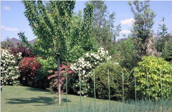
18 - Cultivez des fleurs toute l'année pour rendre votre jardin accueillant pour les auxiliaires