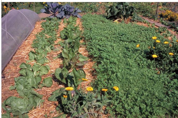
32 - Couvrez la terre avec des engrais verts