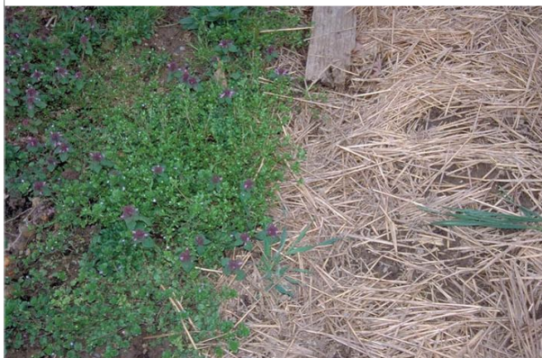
30 - Le paillage limite fortement les herbes indésirables