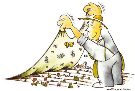
Installez des plantes couvre-sol : des plantes désirées contre des herbes indésirables