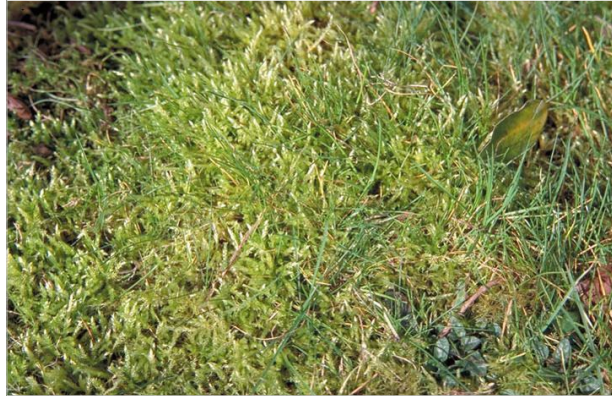
27 - Ne favorisez pas la mousse