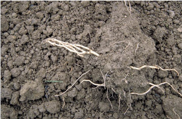
23 - Comment faire avec un terrain envahi d'herbes indésirables vivaces ?