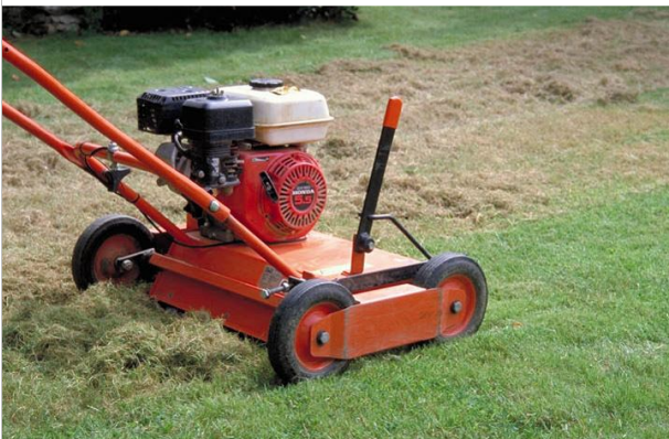
28 - Quelles solutions pour lutter contre la mousse ?