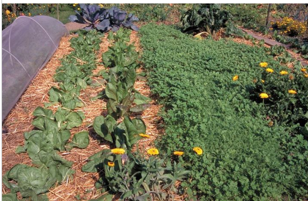
31 - Le paillage est aussi utile dans le potager