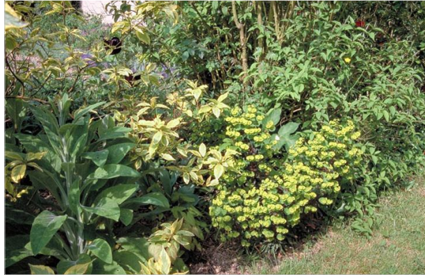
22 - L'euphorbe des bois [au centre], s'est bien intégrée dans ce massif