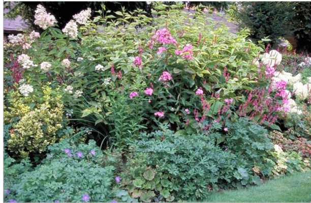
20 - Imbriquez les plantations pour utiliser tout l'espace