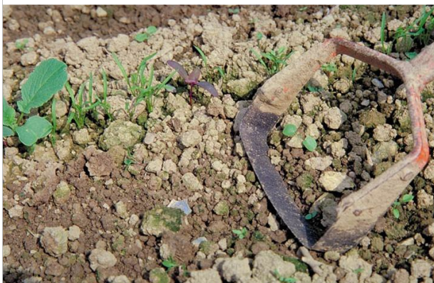
29 - D'abord, semez en rang et sarcliez précocement