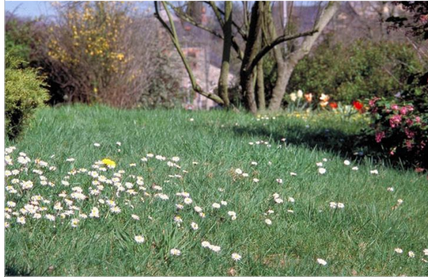
25 - Une pelouse fleurie, c'est tout aussi joli et ça ne pollue pas