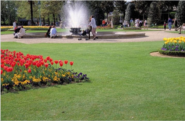
24 - Le désherbage sélectif des pelouses est source de pollution