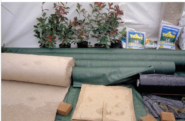
16 – Il existe d'autres sortes de paillis