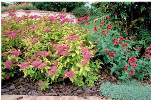
15 - Couvrez le sol avec des écorces de pin