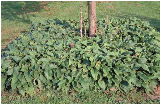
17 - Cette consoude naine possède toutes les qualités d'un bon couvre-sol