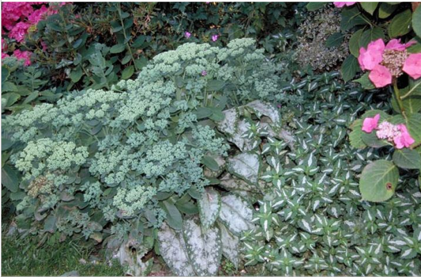
19 - Les lamiers couvre-sol sont décoratifs et utiles