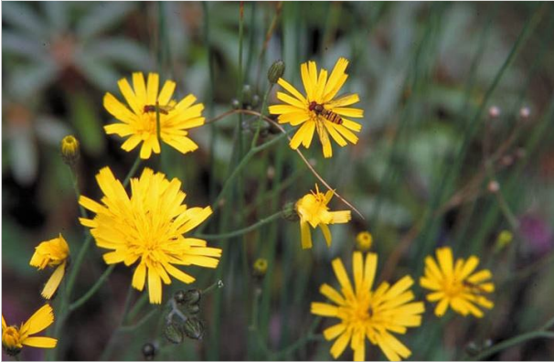
26 - Une pelouse fleurie, c'est utile pour les insectes auxiliaires