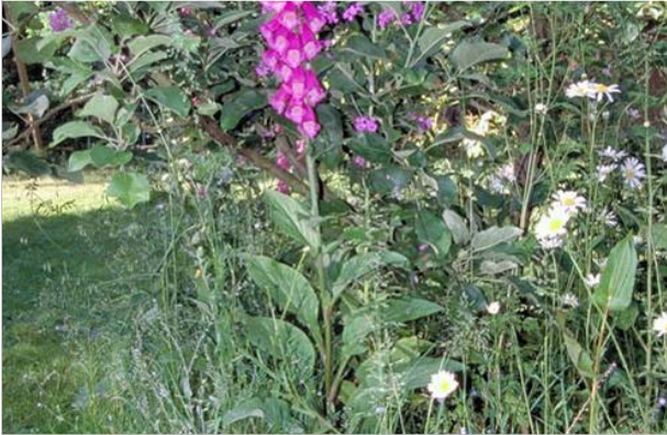
21 - Accueillez les herbes sauvages dans certaines conditions