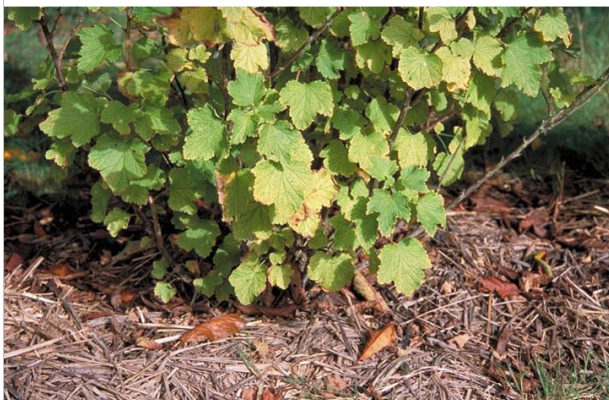
14 - Couvrez le sol avec de la paille