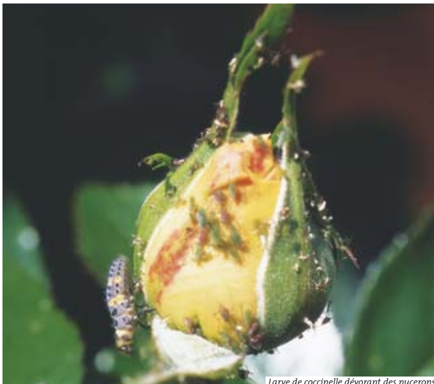
Larve de coccinelle dévorant des pucerons