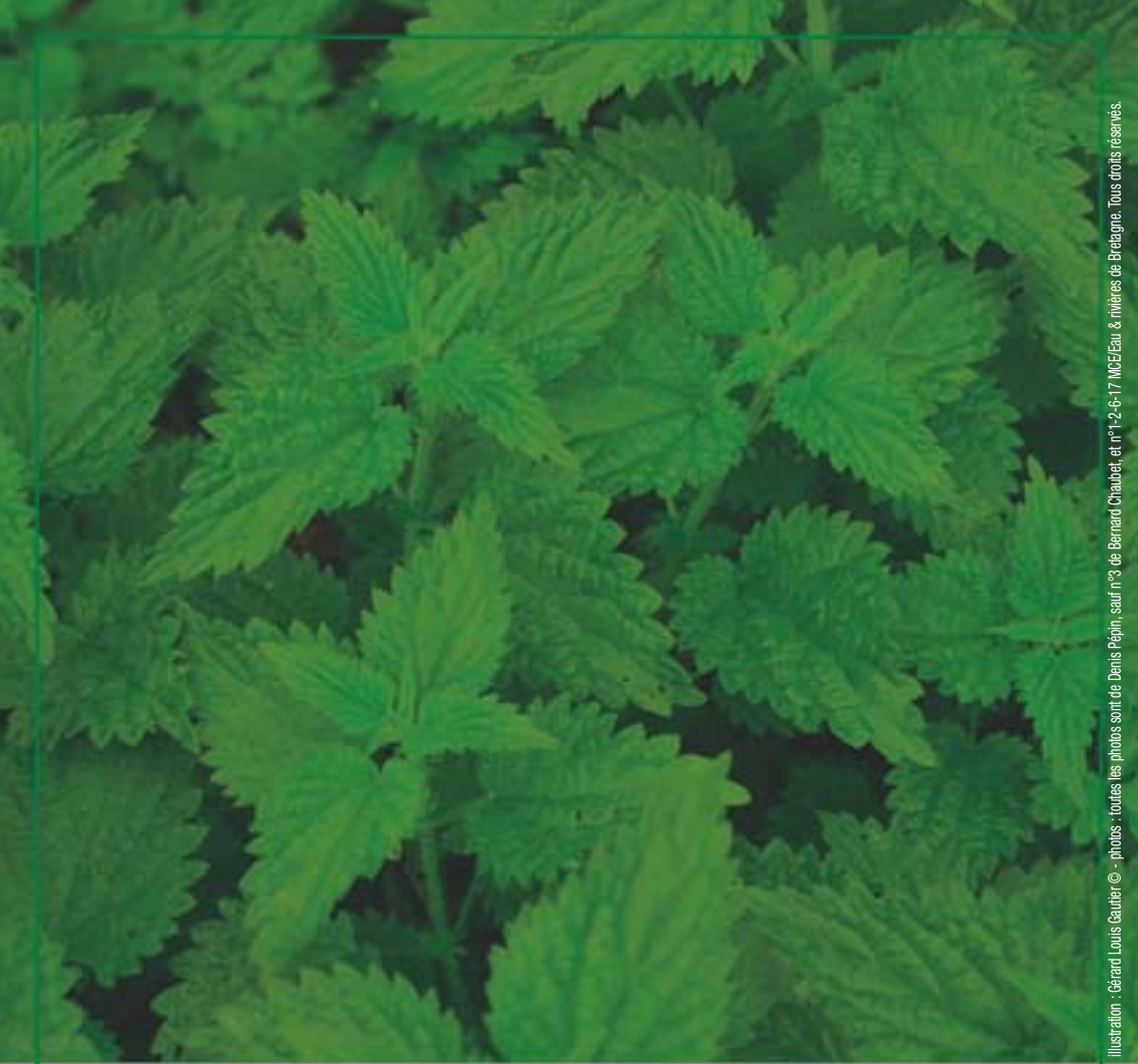
Illustration : Gérard Louis Caubert © - photos : toutes les photos sont de Denis Pépin, sauf n°8 de Bernard Chaubert, et n°1-2-6-17 MCE/Eau & rivières de Bretagne. Tous droits réservés.