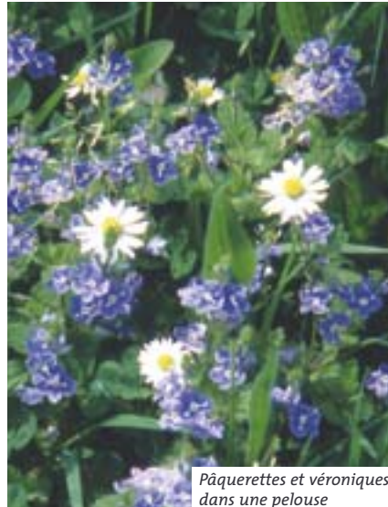
Pâquerettes et véroniques dans une pelouse

CONSEIL : Après le semis de la pelouse, il est fréquent que des plantes sauvages annuelles (qui ne vivent qu'un an) s'installent. Elles seront éliminées dès la première tonte. L'usage de désherbant sélectif peut se justifier seulement dans le cas d'une installation massive de mauvaises herbes vivaces (rumex...) : un seul passage suffira à les éliminer définitivement.