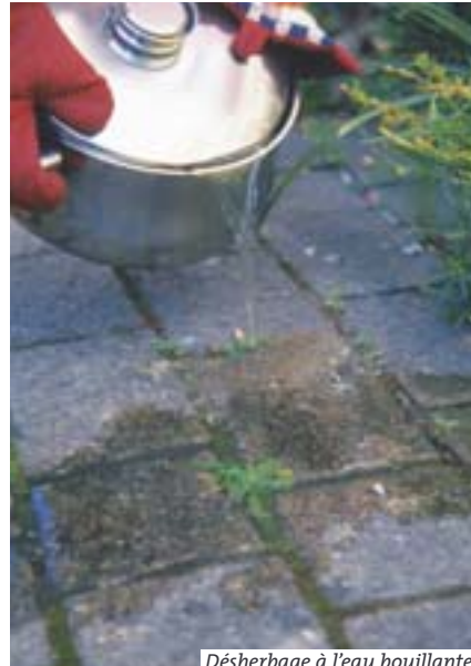
Désherbage à l'eau bouillante