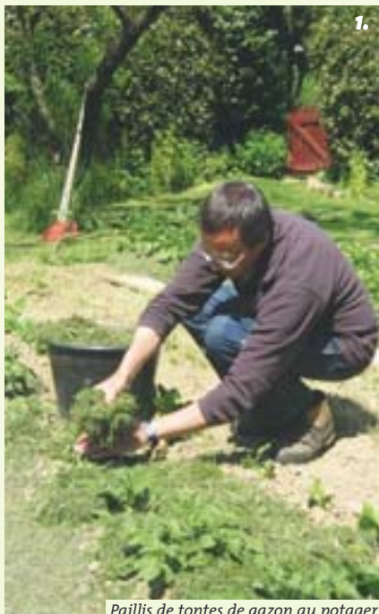
Paillis de tontes de gazon au potager