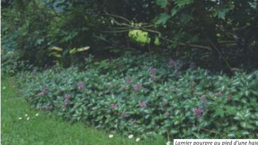
Lamier pourpre au pied d'une haie