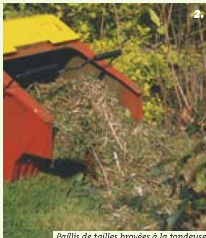
Paillis de tailles broyées à la tondeuse