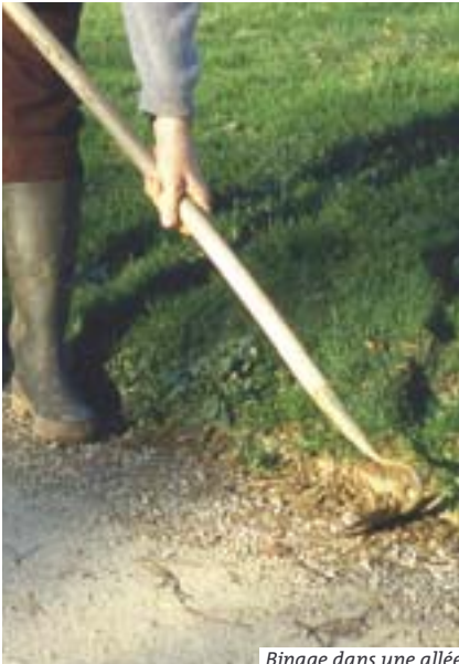
Binage dans une allée