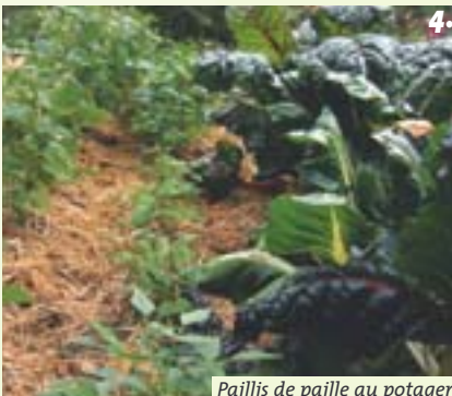
Paillis de paille au potager

Elle convient parfaitement pour les paillis annuels, au pied des légumes, des arbres fruitiers, des fraisiers, des framboisiers, des arbustes, des jeunes haies, en couche de quelques centimètres. Idéale au potager.