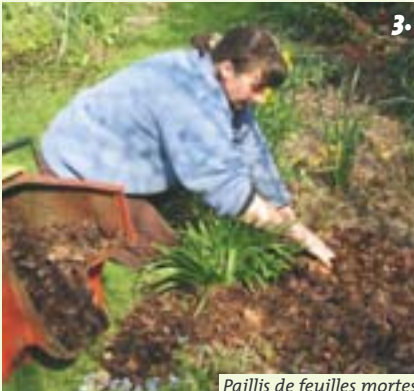
Paillis de feuilles mortes

Pour éviter leur éparpillement par le vent ou les oiseaux, conserver les branches basses des arbustes et étaler des écorces de pin de gros calibre en bordure.