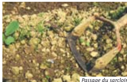
Passage du sarcloir

CONSEIL : Sarcler de préférence le matin d'une journée ensoleillée. Ne pas attendre que les « mauvaises » herbes soient trop développées ou en fleurs.