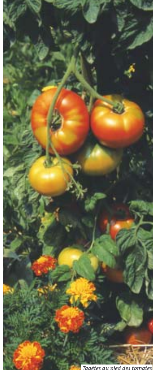
Tagètes au pied des tomates