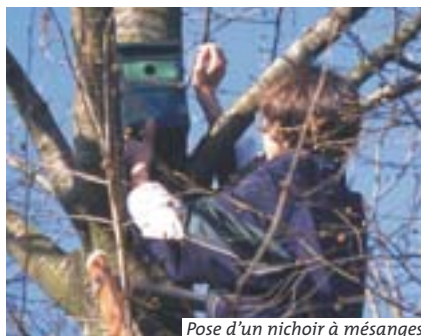
Pose d'un nichoir à mésanges

pour les oiseaux : buis, houx, laurier-tin, noisetier, sureau noir, cornouiller mâle, nerprun alaterné, viorné obier, charme, érable champêtre. Laisser le lierre couvrir la base des haies.