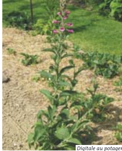
Digitale au potager