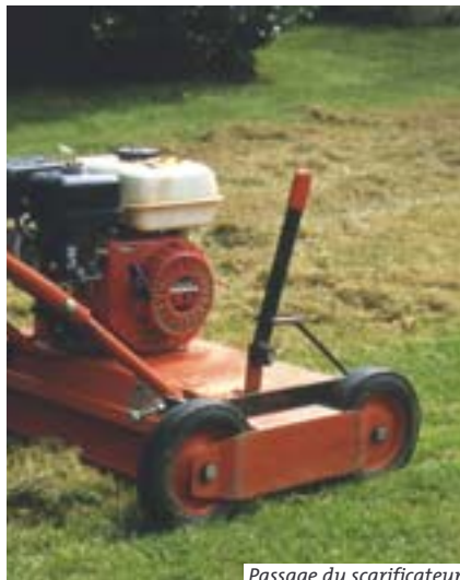
Passage du scarificateur

La mousse ne se montre envahissante que dans certaines conditions : stagnation d'eau en surface, souvent suite au tassement du sol, acidité, gazon inadapté à l'ombre, tonte trop courte.