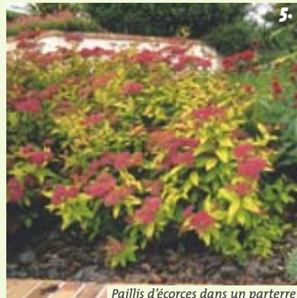
Paillis d'écorces dans un parterre

Elles possèdent parfois un effet dépressif sur les arbustes du fait des essences aromatiques et de la résine : à éviter sous les rosiers et les arbustes chétifs, exigeants en azote ou en calcaire. Les écorces de pin peuvent acidifier le sol, ce qui est favorable aux plantes de terre acide (azalées, hydrangea...). Pour éviter ce risque préjudiciable aux autres arbustes, apporter un peu de calcaire en surface (dolomie, chaux magnésienne) au bout de quelques années.