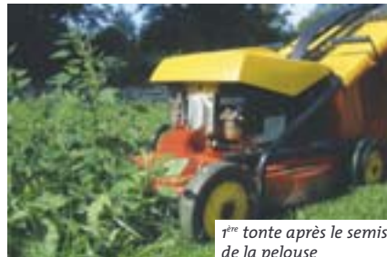
1 ère tonte après le semis de la pelouse

La présence d'herbes sauvages sur la pelouse n'est pas un signe de négligence ou de manque de savoir-faire. Les petites plantes basses qui s'installent peu à peu dans l'herbe ont souvent une jolie floraison (pâquerette, véronique, brunelle, bugle...) et sont utiles pour nourrir les insectes auxiliaires.